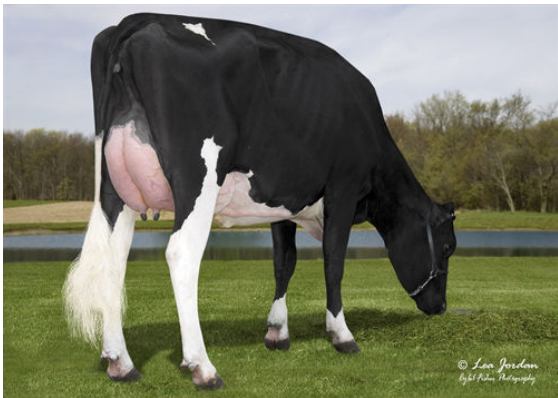
JO-LINE SOCIETY FRANTIC