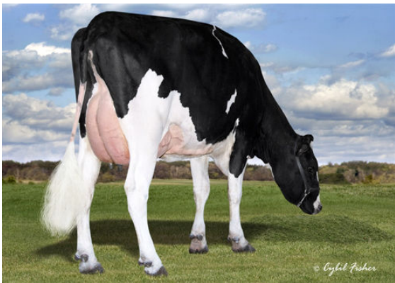
SCHREIBERDALE SOCIETY 3630